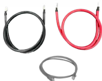
Модель: Кабель RW-F10.6 1500

Деталі: пара кабелів живлення постійного струму 2/0AWG (два кінці з мідними клемми M10) і кабель зв'язку RJ45 для з'єднання з гібридним інвертором. Довжина за замовчуванням 1500 мм.