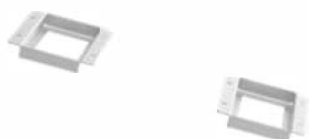
Модель: Основа RW-F10.6

Деталі: у разі встановлення на підлозі використовуйте ці фіксовані опори для кріплення батареї до стіни.