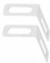
Модель: Фіксована підтримка RW-F10.6

Деталі: пара кабелів живлення постійного струму 2/0AWG (два кінці з мідними клемми M10) і кабель зв'язку RJ45 для з'єднання з гібридним інвертором. Довжина за замовчуванням 1500 мм.